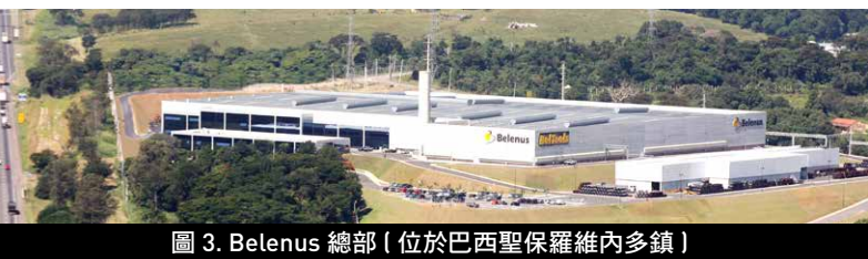
圖 3. Belenus 總部 (位於巴西聖保羅維內多鎮)

新聞提供: Revista do Parafuso (巴西扣件雜誌) 編輯 Sergio Milatias milatias@revistadoparafuso.com.br www.revistadoparafuso.com